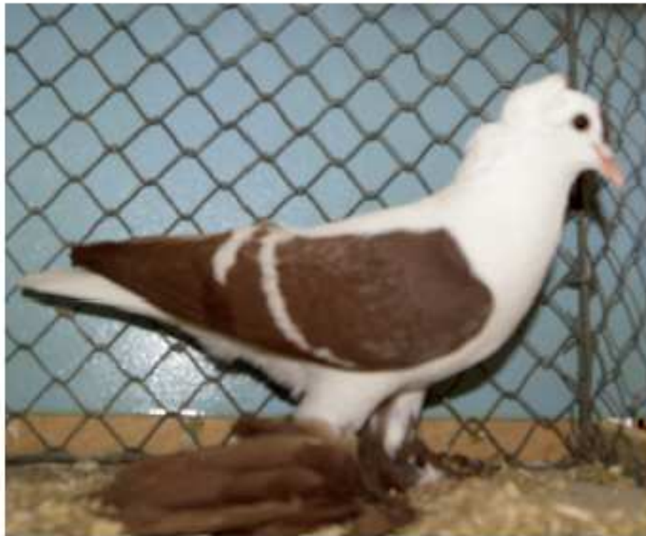
Käfig-Nr. 557 1.0 Sächsische Flügeltaube m. Rundhaube rot m. weißen Binden, vLVEJ Aussteller: Erik Kühne