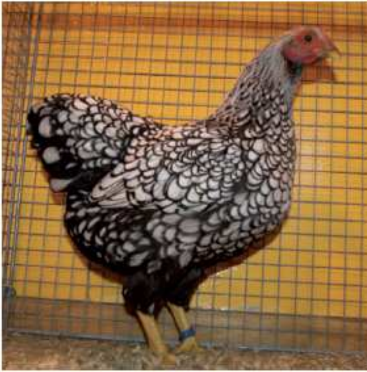
Käfig-Nr. 105 0.1 Zwerg-Wyandotte silber-schwarzgesäumt, vLVE1 Aussteller: Werner Schöne