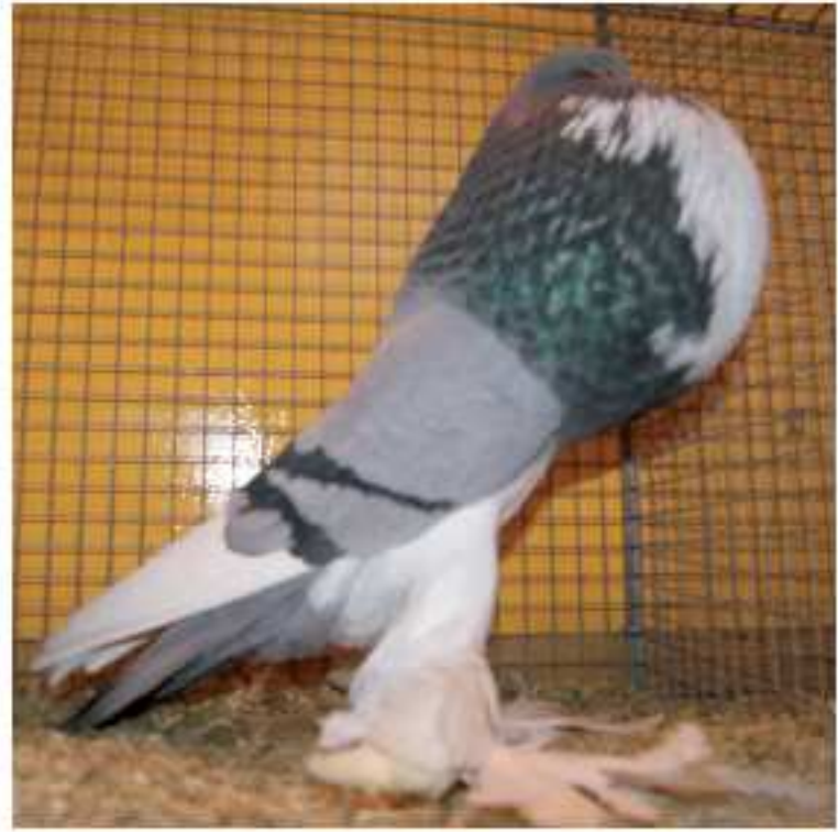
Käfig-Nr. 172 0.1 Pommersche Kröpfer blau-geherzt, vLVE2 Aussteller: Roland Manz